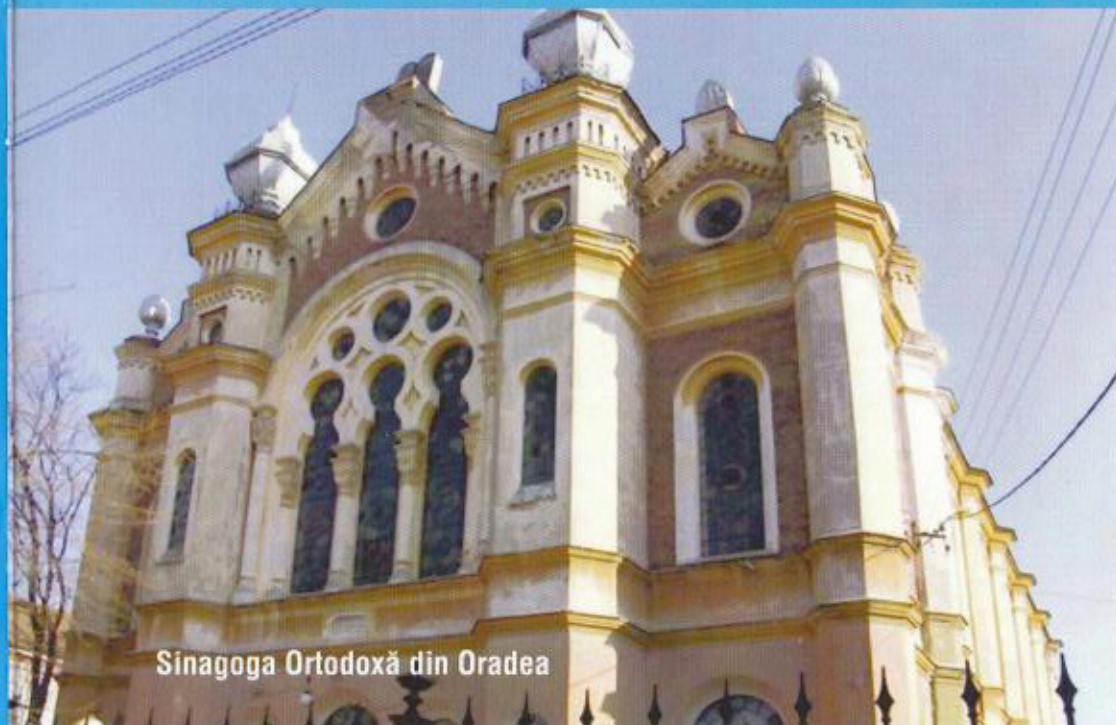
Sinagoga Ortodoxă din Oradea